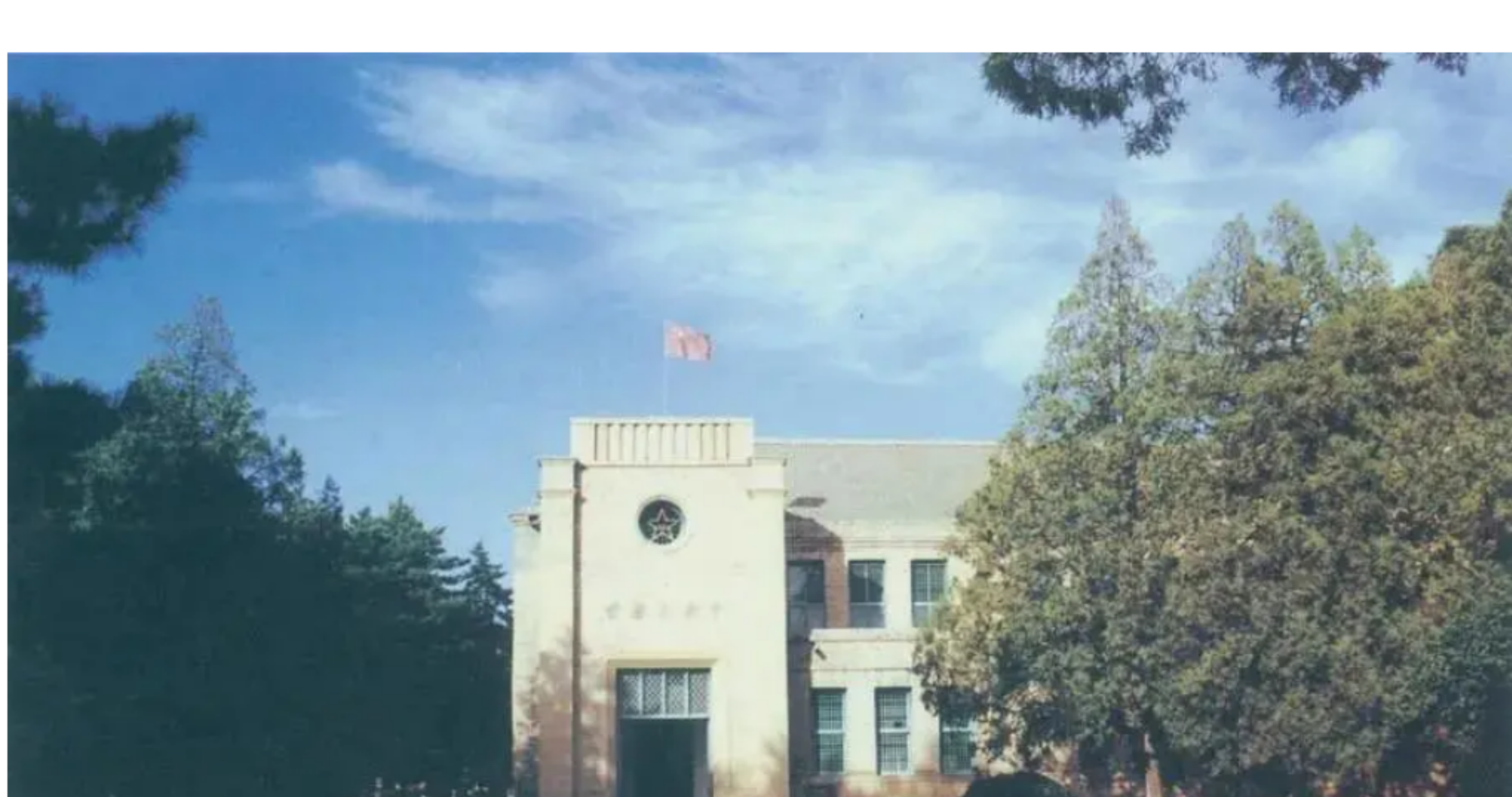
杨家岭革命旧址，位于延安城西北约3公里，是中共中央1938年11月至1947年3月的所在地。